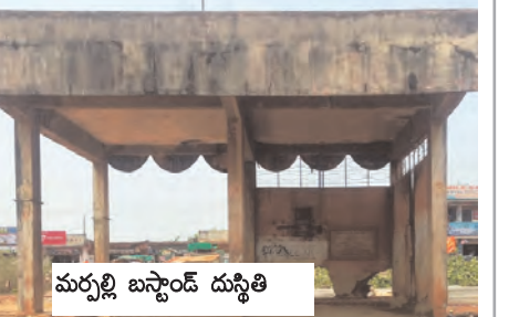
మర్నాటి బస్టాండ్ దుస్థితి

పంచాయతీలుండగా అనేక గ్రామాలకు ఆర్టీసీ సేవలు అంతంత మాత్రమే. మండలంలో ప్రతి మంగళవారం నాడు మాస్టర్, సంత జరుగుతుంది. వివిధ గ్రామాల నుండి పండించిన ఉత్పత్తులు అమ్ము కోవడానికి రైతులు రాకపోకలు చేస్తుంటారు. ప్రభుత్వ కార్యాలయాల, బ్యాంకులు, కళశాలలు మండల కేంద్రంలోనే ఉన్నాయి. ఆర్టీసీ సౌకర్యం లేకపోవడంతో అధిక వ్యాజీలు చెల్లించి ఆయా గ్రామాల ప్రజలు ప్రైవేటు వాహనాలలో రాకపోకలు చేయాల్సి వస్తోంది. కొన్ని సమయాలలో ప్రైవేటు వాహనాలు సైతం లేకపోవడంతో వారి బాధలు వ్యవస్థాపితం. చెల్లెడెవారంతో నిండి పశువులకు నిలయంగా మారింది. మర్నాటి తాలుకా కేంద్రంగా మారినప్పుడు దీనిని నిర్మించారు. కనీస సౌకర్యాల కల్పించకుండా గాలికి వదిలేయడంతో శిథిలావస్థలో చేరింది. బస్టాండ్లోకి బస్సులు కూడా వెళ్లలేదు. బస్సుల రాకపోకలకోసం ఎంపెన్, వాసైన్ రోడ్డు పక్కన నిరీక్షించాల్సి వస్తోంది.