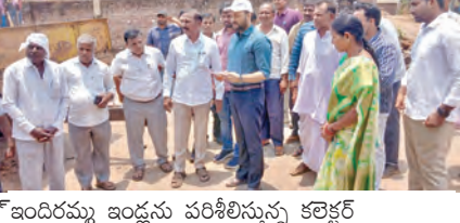
ఇందిరమ్మ ఇండ్లను పరిశీలించుతున్న కలెక్టర్