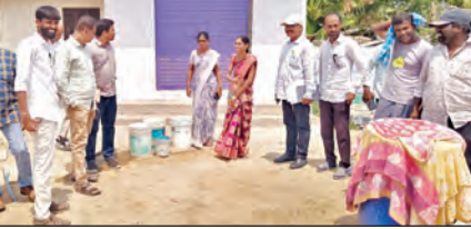
మంబాపూర్లో వివరాలు అడిగి తెలుసుకుంటున్న మిషన్ భగీరథ అధికారులు