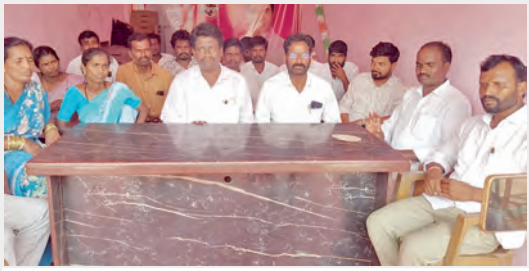
విలేజరుల సమావేశంలో మాట్లాడుతున్న మాజీ ఎంపిటిసి